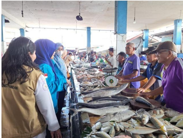
Pendataan di Kabupaten Belitong