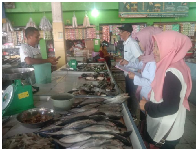
Pendataan di Kabupaten Bangka

Langkah ini melibatkan survei langsung di pasar tradisional/modern dan sentra produksi (tangkap/budidaya) oleh petugas DKP Kab/Kota. Data yang dikumpul mencakup harga real-time (Rp/kg) untuk 10 komoditas utama, dibandingkan dengan harga normal. Tujuannya untuk mendeteksi fluktuasi dini (misalnya, kenaikan 10-20% akibat euforia HBKN atau musim angin barat). Integrasikan dengan data produksi tahun sebelumnya untuk prognosa awal.