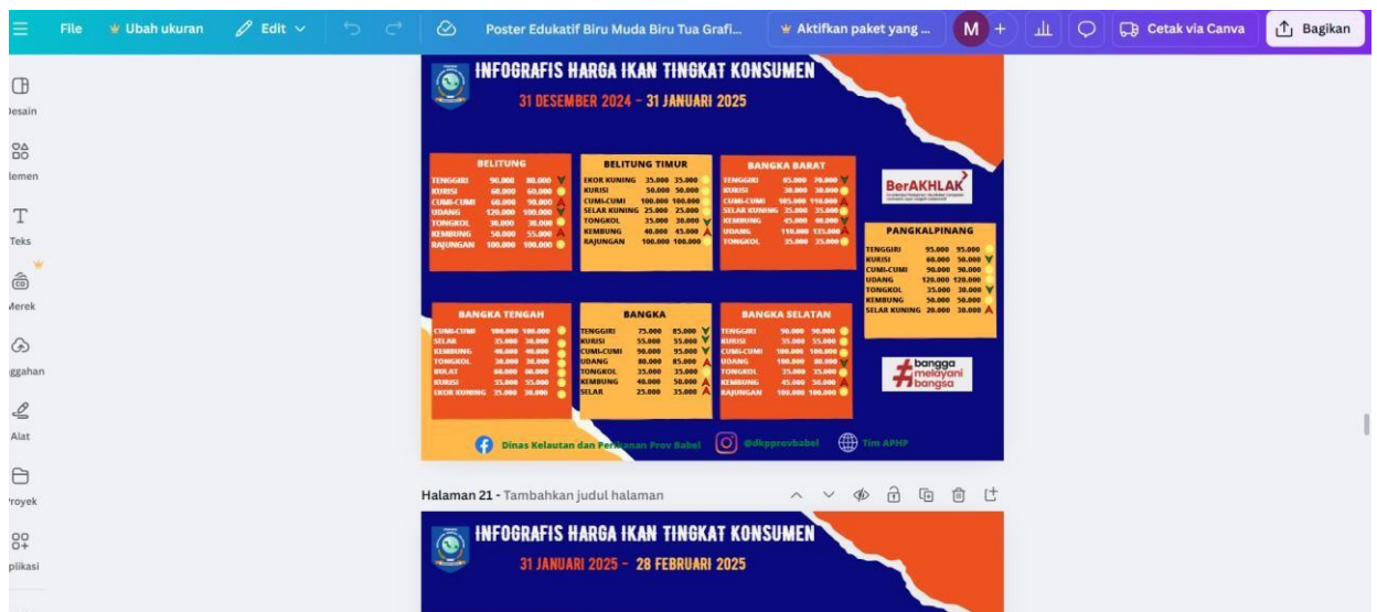
Pembuatan infografis oleh koordinator provinsi

Berdasarkan rekap, buat infografis visual (menggunakan Canva) yang mencakup tren harga. Sertakan elemen grafis seperti ikon kenaikan dan penurunan harga ikan untuk kemudahan pemahaman publik.