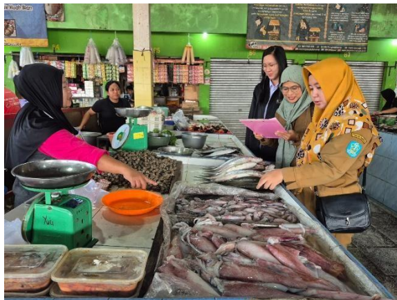
Pencatatan oleh enumerator

Petugas mencatat detail komoditas, harga, dan keterangan (seperti faktor penyebab kenaikan) dalam formulir standar. Ini memastikan data lengkap dan traceable, menghindari error seperti duplikasi atau kelalaian. Contoh: Harga selar Rp30.500/kg (saat ini) vs. Rp28.000/kg (normal).